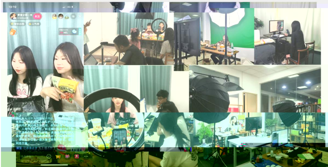
部份学员在进行电商直播实训现场